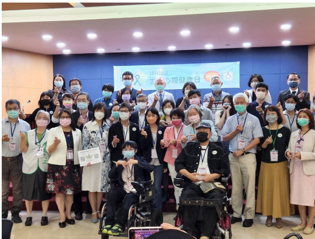
立委 蔡璧如、王婉諭、范雲